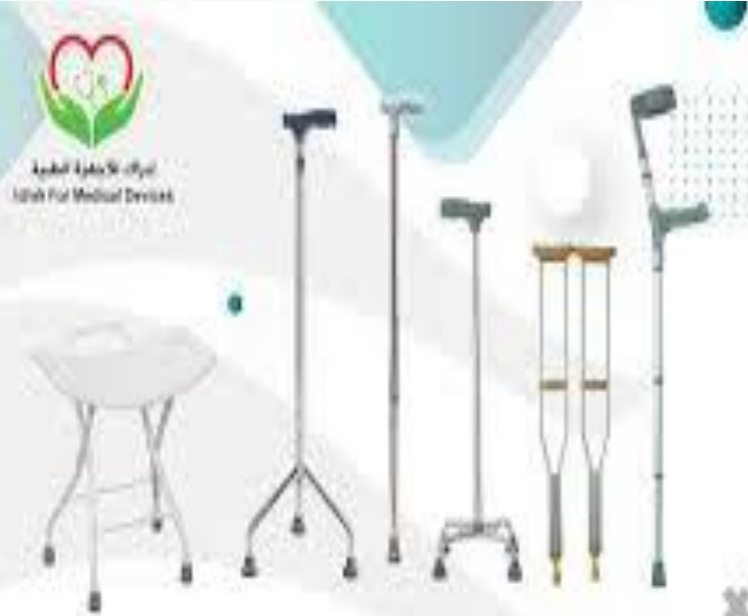
عكاز المشي الطبي وكراسي الإستحمام